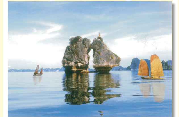
"Vinh Ha Long" die Halong-Bucht (Vietnam) wurde 1994 von der UNESCO zum Weltkulturerbe erklärt.